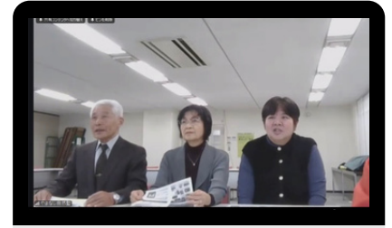
やまなし自然塾の方々

今回お話を聞き、自然を日々観察しながら追求してこられた歴史は、本当に素晴らしいなあと思いました。30年かけて培われてきた成果は、育てることへの皆さんの愛情から生まれたことのように思います。地球温暖化など気候の変化の中で、自然と対話しながらの作業、感謝します。浄化された土壌がこれからも広がっていくこと、そして、山梨産のブドウ、モモなど、土壌の実りが豊かであることを願っています。