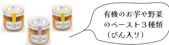
有機のお芋や野菜のペースト3種類(びん入り)

離乳食の試食は、大人にも子どもにも好評でした。「市販の離乳食は素材の旨みもなく味気ないけど、値段も決して安くないので捨てることはできず、もったいないので子どもの残りを食べていた。だけど、グリーンコープの離乳食は美味しいので大人も食べやすい!」「もし残っても蒸しパンやホットケーキに混ぜて使い切れればいいね!」などの感想が聞けました。みなさん話もしっかり聞いてくださり、逆に離乳食の注文方法は私の方が教えてもらいました(笑)細々ですが、今後もおしゃべりカフェを続けていきたいと思ひます。みなさんぜひご参加くださいね。