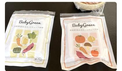
発売されたばかりの離乳食の種類を体感していただく「試食会」