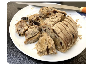
一度食べたら分かる！美味しい「クリスマスケーキの試食会」