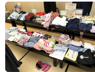
就労・就学支援に繋がるファイバーリサイクルを兼ねた「お譲り会」