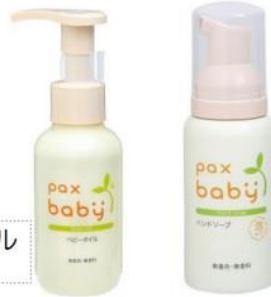
バックスベビーオイル ポンプタイプ

とても潤って乾燥肌の私も娘も重宝しそうです! ポンプ式なのもポイント高いです!!