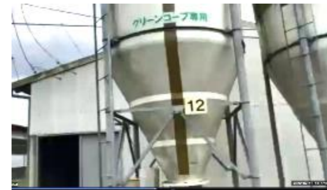
グリーンコープ用飼料サイロ

ここ1年で飼料価格が1.5倍も上がっているのに市場価格は変わらないという生産者にとって危機的状況がおこっています。今現在、豚肉の在庫がたくさん残っており、このままだと組合員に食べていただくために丹精込めて育てた豚は一般市場へ出荷しなければいけなくなるそうです。私たち組合員が利用することで、生産者の励みになります。まだ購入したことのない方はまずは一度食べてみてください。いつも購入している方は、もうひとつプラスして購入してもらえると嬉しいです。