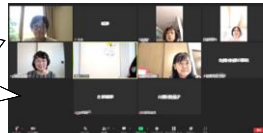
オンライン学習会の様子