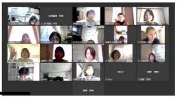
オンライン開催の様子

2021年度の地区組合員総会は、オンラインで行いました。総代の選出など滞りなく行われました。各ワーカーからのアピールでは特にお店のワーカーの立場から地区会へ要望をもとめたりと、普段なかなかできない交流ができてよかったです。