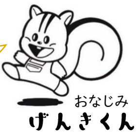
おなじみ げんきくん