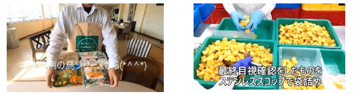
オンライン学習会の様子

第一部では、無事12名の総代が承認されました。第二部では、(株)ナカシン冷食の方を講師にお招きし、学習会を行いました。徹底した衛生管理、マンゴーの糖度平均が16度以上、パインは追熟しないので完熟させてすぐに現地で加工など、美味しさの秘密を教えてくださいました。