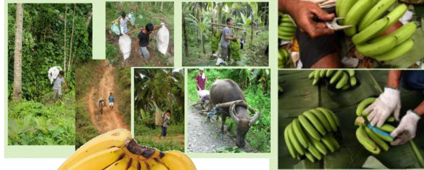
園場から集荷所までの運搬

フィリピンのネグロスで、化学合成農薬や化学肥料、防カビ剤、防腐剤などを一切、使用せずに栽培された、安心安全なバナナです。市販のバナナは大規模プランテーションで農薬や防腐剤を散布されていること、現地土を汚していることなど、写真をみながら説明をききました。