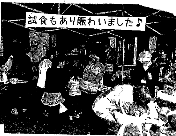
試食もあり賑わいました♪