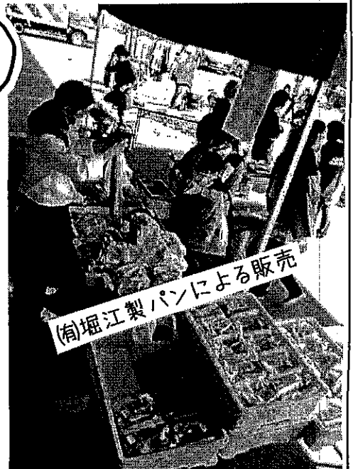
南堀江製パンによる販売