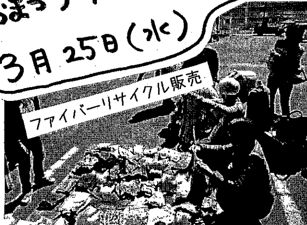
ファイバーリサイクル販売